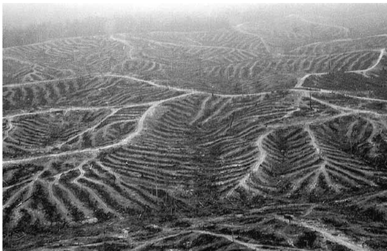
Hierboven het resultaat van ontbossing. Elk jaar verliest Indonesië een bosareaal ter grootte van Connecticut.

Aangezien dit water ongelijk over de wereld verdeeld is, wordt in veel dichtbevolkte of droge gebieden praktisch de volledige voorraad toegankelijk water opgesoupeerd. We hebben meer dan 42.000 duizend grote dammen aangelegd die, tezamen met kleinere waterreservoirs en andere waterbeheersingstechnologieën, bijna tweederde van alle rivieren op aarde indammen. Een gebied ter grootte van Frankrijk is onder kunstmatige waterreservoirs verdwenen. 45 Sommige rivieren als de Colorado River, de Nijl en de Gele Rivier worden zo zwaar geëxploiteerd dat maar weinig van hun water de zee bereikt, waardoor de rijke ecosystemen en visgronden die ooit door hun riviermondingen in stand werden gehouden, geruïneerd worden. Als gevolg van de vervuiling en het overdadig gebruik van onze rivieren en meren heeft zo'n veertig procent van de wereldbevolking onvoldoende water voor de riolering en de dagelijkse hygiëne, en beschikt bijna een op de vijf mensen over onvoldoende drinkwater. 46 Als we de huidige trends extrapoleren, zullen tegen 2025 ongeveer drie miljard mensen – of ruim eenderde van de wereldbevolking – in landen met een gespannen drinkwatervoorziening en chronische waterschaarste wonen, een verzevenvoudiging ten opzichte van 1997. 47