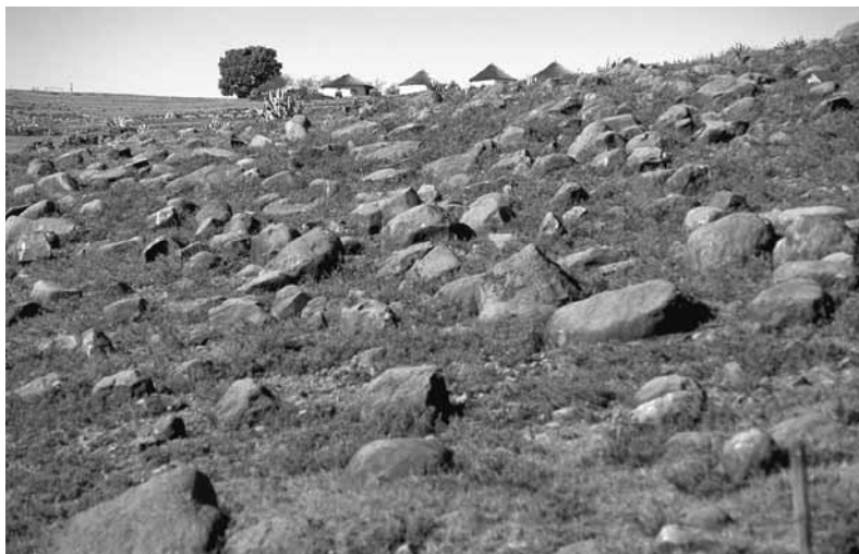
Waar de grond wegspoelt, blijven alleen keien achter.

waterbekkens en delta's van de grote noordelijke rivieren als de Ganges en de Brahmaputra. Vandaag de dag is de natuurlijke leefomgeving in deze volgepakte streken op gruwelijke wijze aangetast: bossen werden al lang geleden tot landbouwgrond omgevormd; deze landbouwgronden zijn op hun beurt ofwel door allesverslindende steden opgeslokt, of uitgeput, verzilt, verzuurd en door overdadig gebruik en irrigatie te zeer door water verzadigd geraakt. Ondergrondse bronnen, en meren en rivieren hebben zwaar te leiden onder het lozen van het rioolwater van de steden en het afval van slecht gereguleerde industrieën als farmaceutische installaties, kunstmestfabrieken en werkplaatsen voor galvanisering.