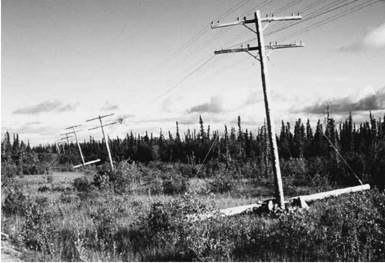
Overhellende telefoonpalen in Alaska als gevolg van de smeltende permafrost.

heeft, waarmee dit het grootste door insecten veroorzaakte verlies aan Noord-Amerikaans bosareaal is dat ooit werd vastgelegd. 9