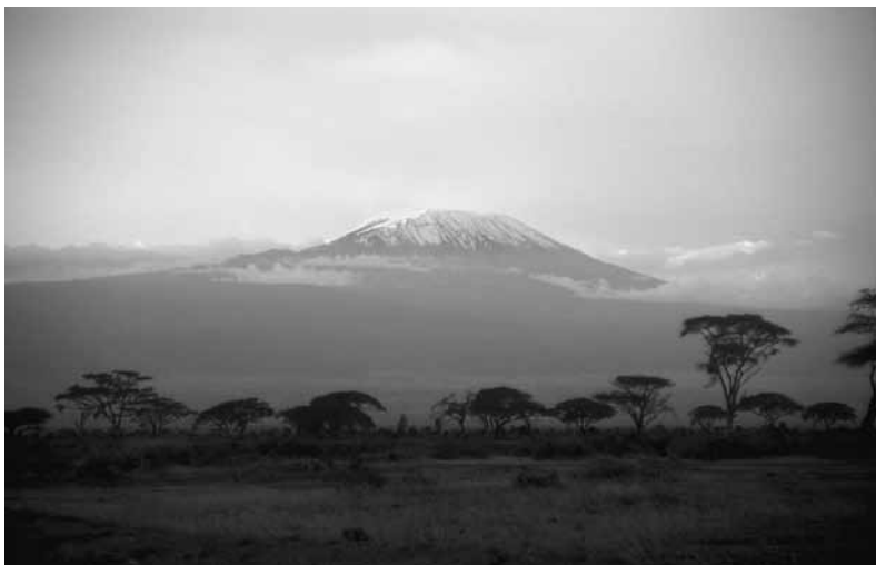
De Kilimanjaro bij zonsopgang in april 1983.

Onze slapeloze nacht werd ruimschoots vergoed door wat we de volgende ochtend vroeg voorgeschooteld kregen. Terwijl we behoedzaam uit onze tent kropen, vonden we de olifanten in het landschap opgesteld, waaronder twee babyolifantjes naast een acaciaboom op krap vijftig meter bij ons vandaan. En naar het zuiden, net over de grens met Tanzania, torende de Kilimanjaro zes kilometer boven de Afrikaanse savanne uit. De met ijskappen bedekte oude vulkaan gloeide op in het roze ochtendlicht.