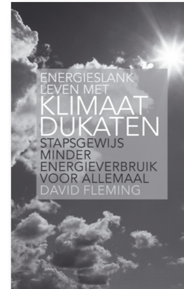
David Fleming Energieslank leven met klimaatdukaten Stapsgewijs minder energieverbruik voor allemaal

isbn 978 90 6224 484 3 100 pagina's € 5,- (plus porto) bestellen op www.hitte.nu